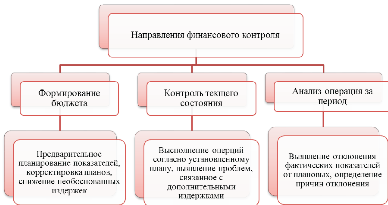
Рис. 3. Роль финансового контроля в снижении издержек

контроля, так как именно мотивированные работники будут стараться не допускать необоснованных затрат в своей деятельности.