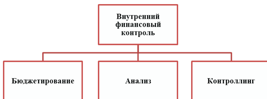
Рис 1. Организация финансового контроля предприятия

Для формирования и роста экономического, промышленного, научно-технического и социального потенциала страны научно-производственные предприятия (НПП) в современном мире играют значительную роль [6; 7; 8; 9; 10; 11; 12; 30; 35; 36]. Экономическая роль НПП заключается в экономии затрат, повышении доходов, производительности труда за счет инноваций технологий, техники, сырья и материалов производства. Согласно официальным данным статистической службы РФ за последний период удельный вес научно-производственных организаций имеет тенденцию к снижению. Так, в 2008 году удельный вес НПП составлял 9,6%, в 2009 году – 9,4%, в 2010 году – 9,3%, в 2011 году